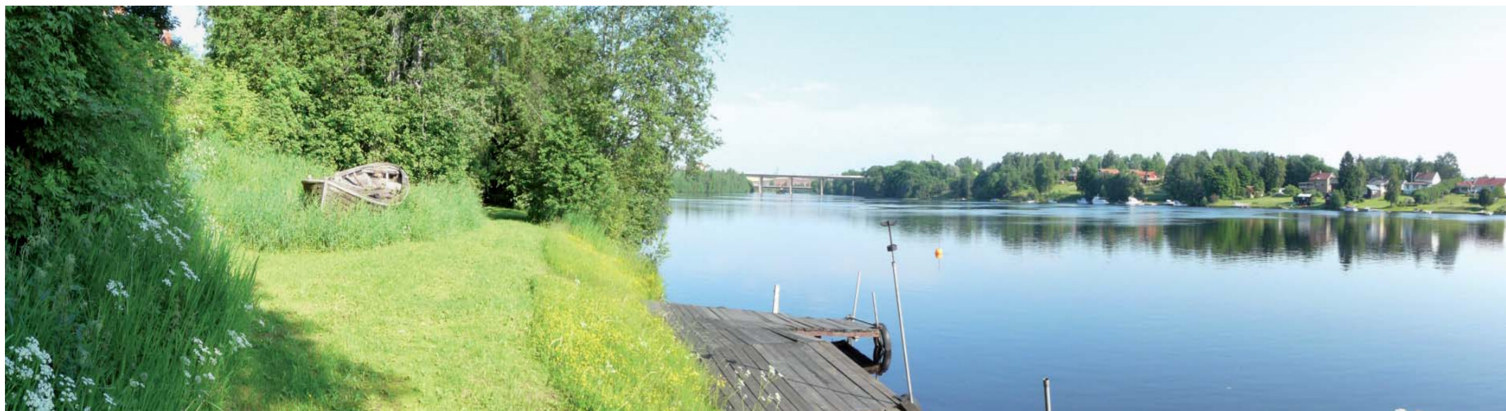
Figur 7. Vy utmed älvråstråket.

I området finns ett utvecklat gång- och cykelvägnät som tillsammans med de större öppna gräsytorerna används som rekreationsstråk. Från Matjes Emils gård är det möjligt att ta sig ner till älven och Ångbåtsbryggan. Vid gamla brofästet i Färjegårdarna kan man också nå vattnet, men platsen inbjuder inte till någon längre vistelse.