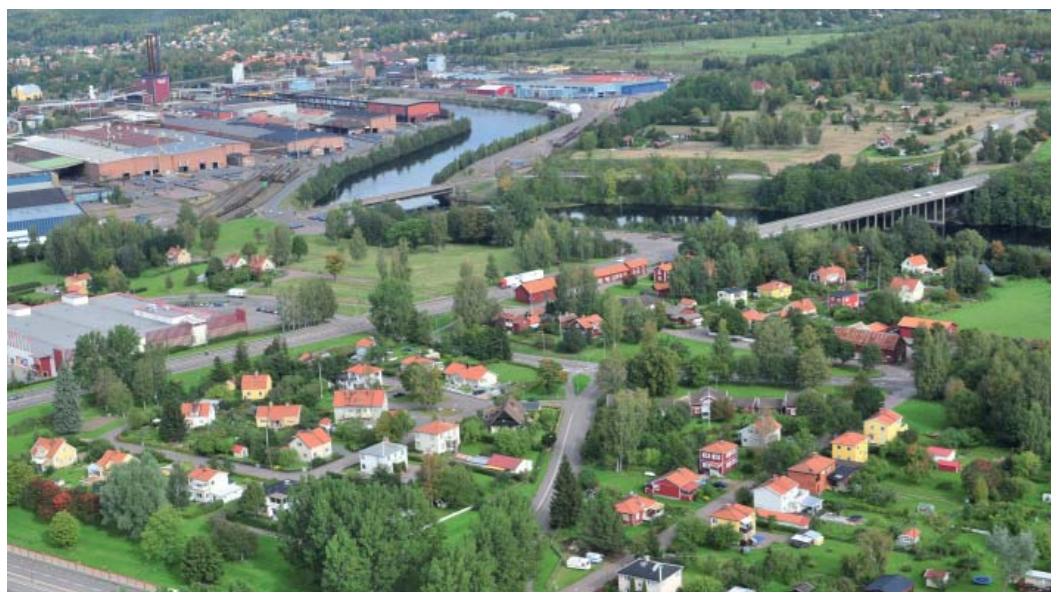
Figur 5. Villabebyggelse i Mjälga.