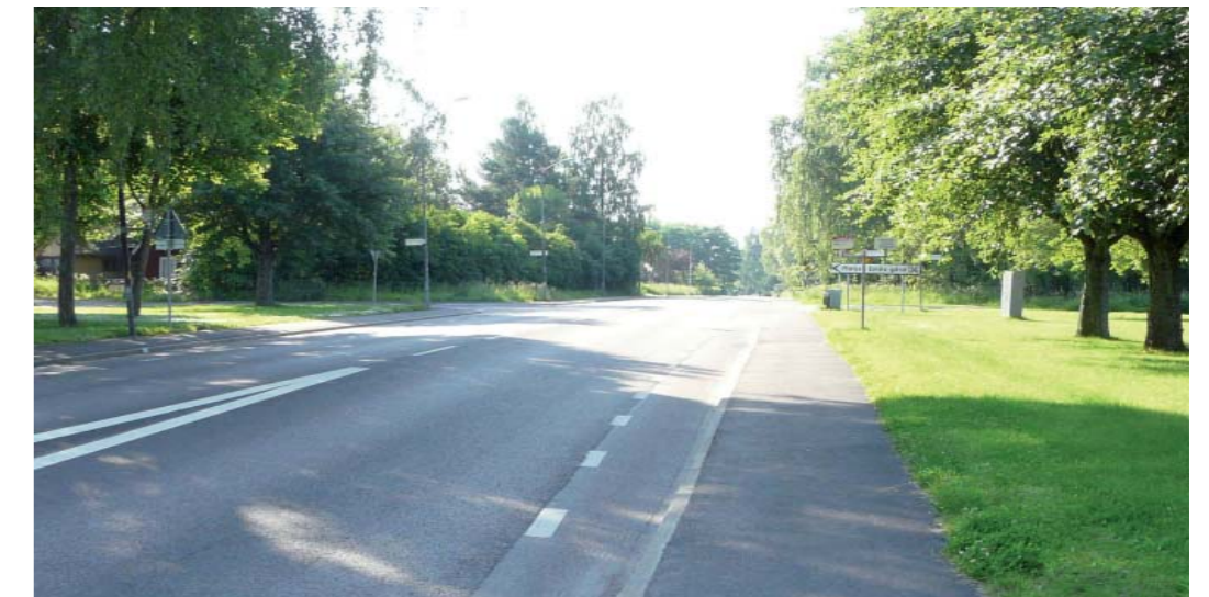
Figur 4. Mjälgavägen sett mot söder.

Området försörjs av en busslinje med avgångar varje timme, vardag som helgdag.