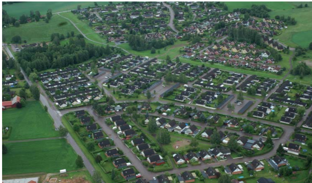
Figur 6. Villabebyggelse i Årby och Färjegårdarna. Årby återfinns i förgrunden och Färjegårdarna i bakgrunden.