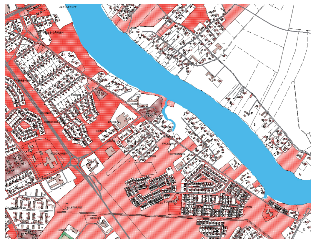
Figur 3. Markägoförhållanden inom planområdet. Röda ytor visar kommunens innehav.

Det största markinnehavet ägs av Borlänge kommun, följt av AB Stora Tunabyggen, SSAB och slutligen privata markägare.