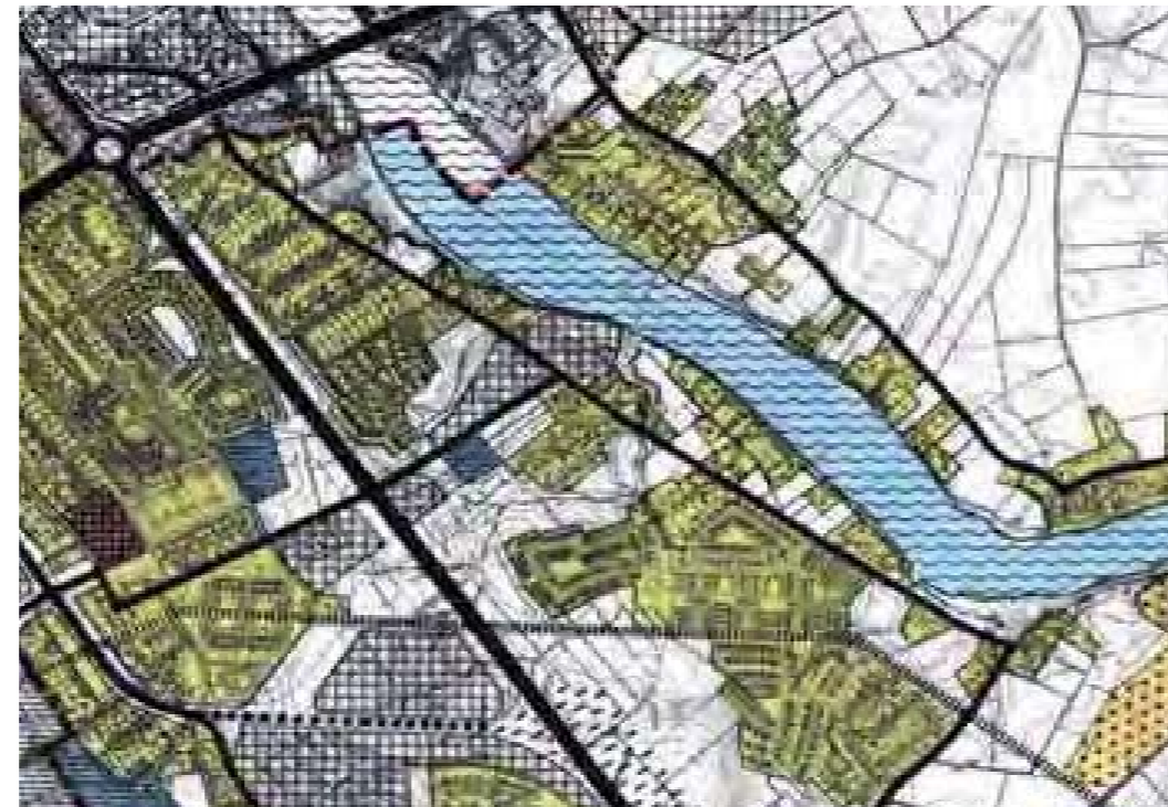
Figur 2. Utdrag ur Översiktsplan -90. Planområdet återfinns i kartans mitt.

För planområdet gäller Översiktsplan -90 för Borlänge kommun, antagen av kommunfullmäktige 1991-02-28. Planen aktualitetsförklarades senast 1998-06-17. Markanvändningen anger bostäder, arbetsplatser och idrottsanläggning. Ytan för arbetsplatser är förlagd norr om Gyllehemsvägen.