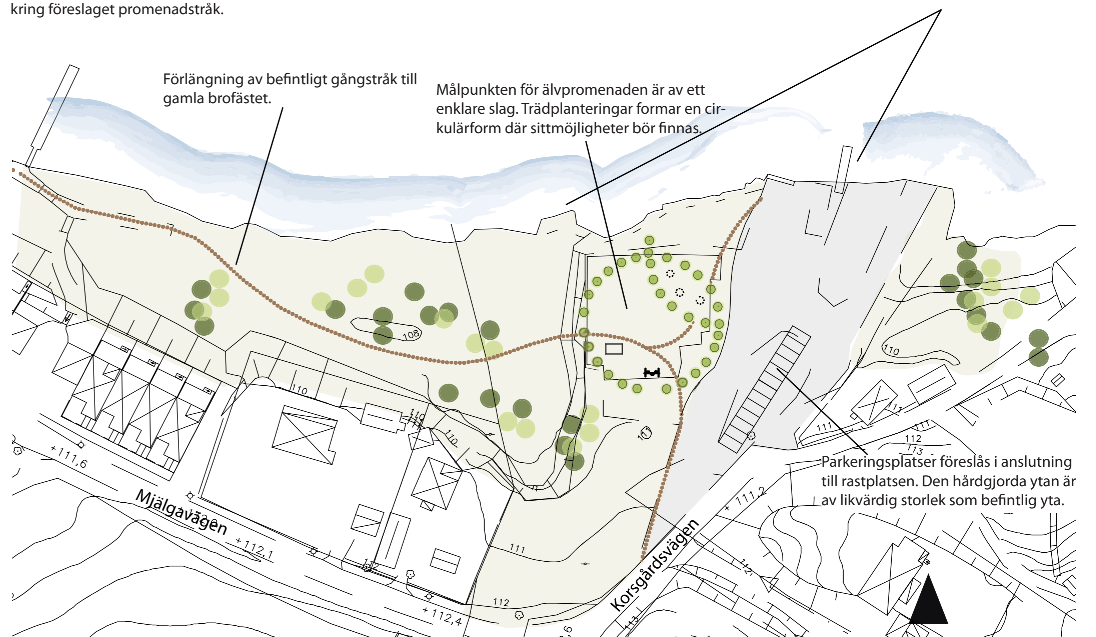
Figur 8. Illustration över gamla brofästet i Färjegårdarna.

Båtramp som del i projektet farled Dalarna. Den bör flyttas i östlig riktning för att underlätta isättningen av pontonbron. Brygga för båtplatser och fiske föreslås anläggas i strandlinjen.