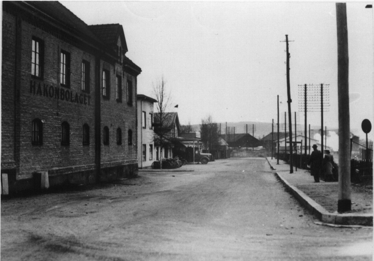
Västra Järnvägsgatan 1943

var ju också den plats där kämpalekar och idrott utövades” konstaterar Stora Tuna kommunalfullmäktige 27/10 1952. Gatan var belägen i Gylle .