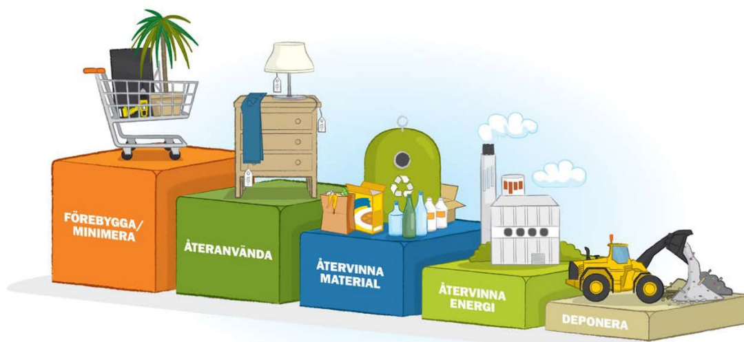
Figur 1. Avfallstrappan anger prioriteringsordning för hur avfall ska hanteras. Trappstegen är Förebygga/minimera, återanvända, återvinna material, återvinna energi och deponera.

De kommunala kretsloppsplanerna är centrala för att nå ett mer resurseffektivt och cirkulärt Dalarna!