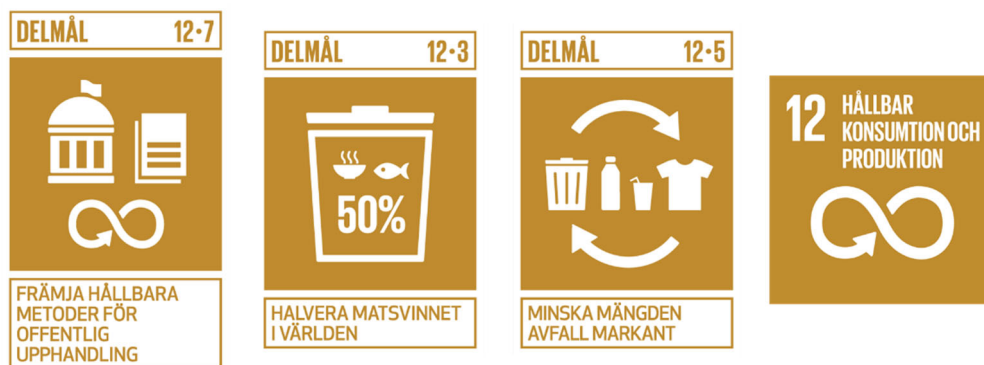
Figur 5. Mål 12 med delmålen 12.3, 12.5 och 12.7 – Globala målen för hållbar utveckling i Agenda 2030.

Internt inom kommunens verksamheter uppstår både kommunalt avfall och verksamhetsavfall. Det saknas uppgifter om avfallsmängder från kommunala verksamheter, men klimatnyttan och ekonomiska synergier bedöms ändå bli betydande om mängden avfall minskar då kostnaderna för insamling och behandling är höga och sannolikt kommer att stiga. Kommunala verksamheter omfattas också av kraven på insamling av förpackningar och obligatorisk insamling av matavfall från 2024.