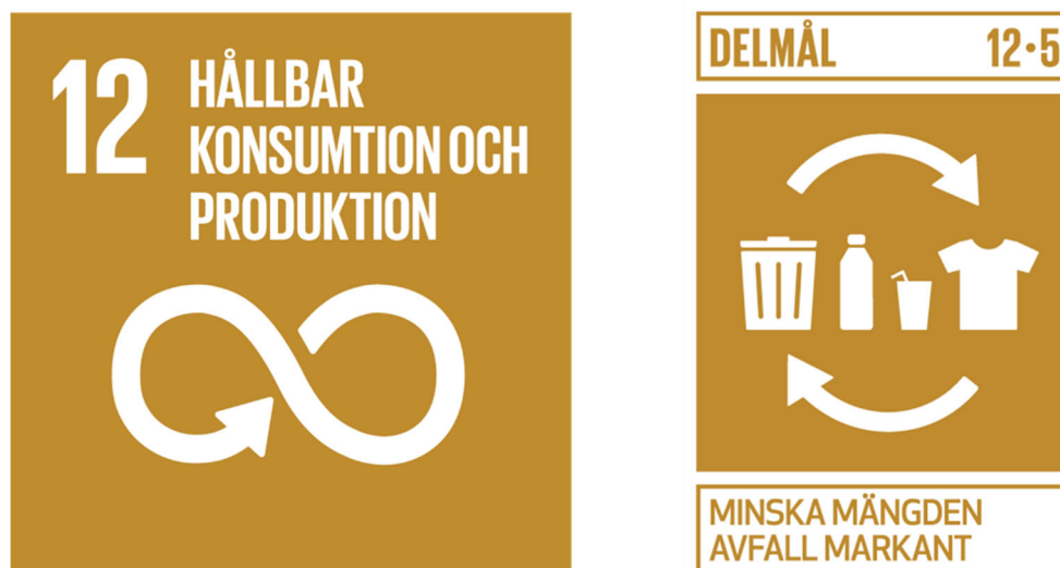
Figur 6.. Mål 12 med delmålet 12.5 – Globala målen för hållbar utveckling i Agenda 2030.

Bygg- och rivningsavfall är ett viktigt område då det uppkommer stora mängder och det dessutom har stor miljö- och klimatpåverkan. Det saknas dock uppgifter om mängden byggavfall som finns i Dalarna. Den vanligaste behandlingsmetoden för bygg- och rivningsavfall är att det återvinns som konstruktionsmaterial, följt av deponering och energiåtervinning. Konventionell materialåtervinning, som återvinning av metaller, plast och papper, står för endast två procent.