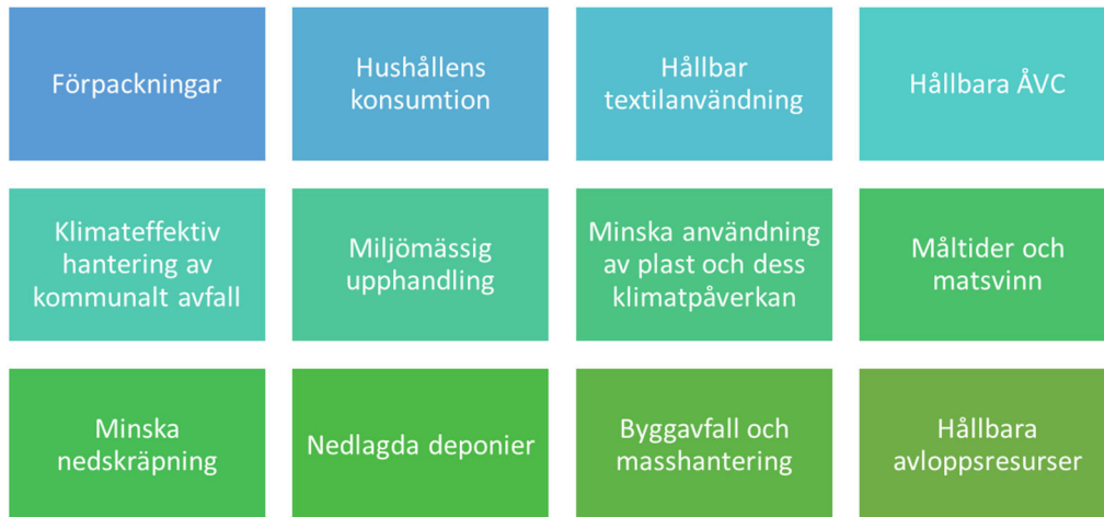
Figur 2 De tolv temagrupper som fokuserat på olika områden med koppling till kretslopp och cirkulär ekonomi.

Under 2022–2023 har 15 seminarier och webinarier hållits med över 700 deltagare. Temagrupperna har haft en viktig funktion genom att höja kunskapsgrunden för vad som kan göras inom respektive område. De utgör också en grund för genomförandet, då flertalet av dem avses vara kvar under genomförandeperioden (vissa temagrupper kan komma att slås ihop).