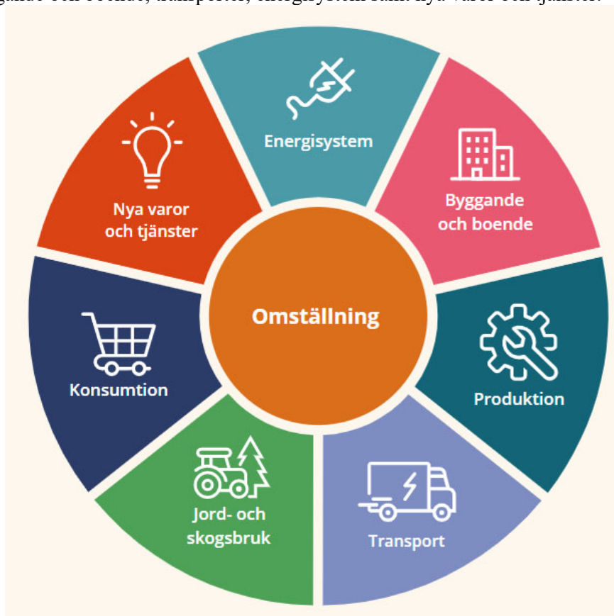
Figur 7. Energiintelligent Dalarnas strategi med sju olika områden för att bidra till att nå målet om ett energiintelligent och klimatsmart Dalarna 2045.

För detta ändamål kopplas kretsloppsplanens genomförande till det löpande arbetet i Energiintelligent Dalarna där mycket av länets strategiska arbete kring hållbarhet och resurshushållning drivs. Det gäller bland annat områdena konsumtion, byggande och boende, transporter, energisystem samt nya varor och tjänster.