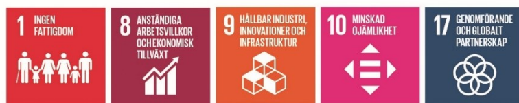
Figur 3 Mål från Agenda 2030

Näringslivsmålet i den strategiska planen pekar främst mot följande Agenda 2030-mål: