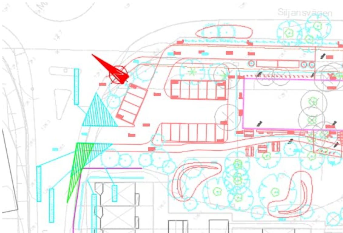
Siktlinje och triangler, anslutning mot Spelmansgatan

Siktkontroll enligt VGU för hastighet 30 km/h visas med sikttriangel (grön färg) 17x5 m för god standard. Denna tangerar precis muren vid fastigheten längs Spelmansgatan.