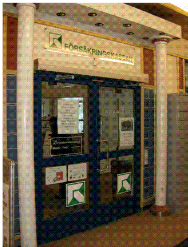
Entrén till Försäkringskassan

Besöksadress : Stationsgatan 2-4 www.forsakringskassan.se