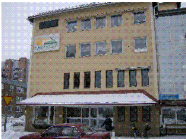
Stora Tunabyggen, Vasagatan 27

Besöksadress: Vasagatan 27 www.tunabyggen.se