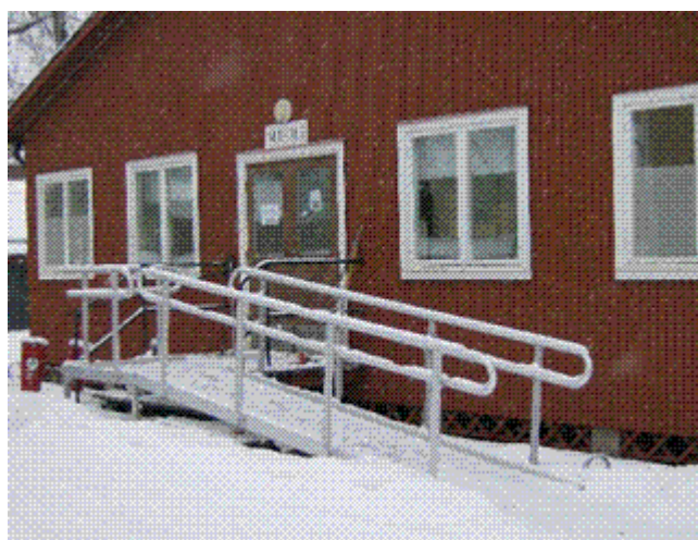
Entrén till RSMH's lokal, Utanforsvägen 6

Besöksadress: Utanforsvägen 6 www.rsmh.se