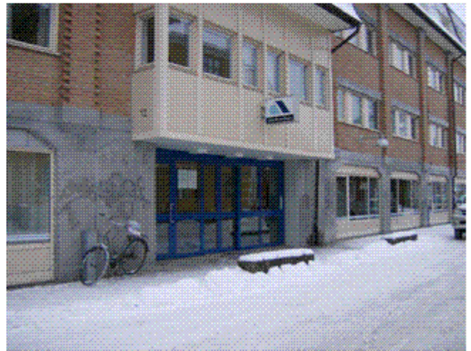
Arbetsförmedlingen, Borganäsvägen 12