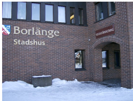
Ingång till Socialkontoret från Röda vägen

På kommunens socialkontor kan du få information om samhällets möjligheter till stöd. Du kan få hjälp att göra en planering av vilka insatser som är lämpliga för dig.