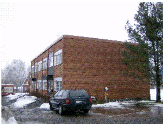
Mjälgavägen 49 H

Adress till behovsbedömare: Borlänge stadshus, Röda vägen 50 Hus D, 2 trappor