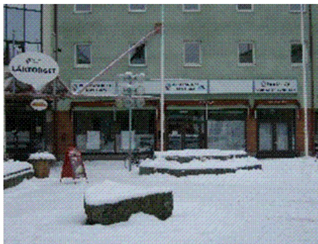
Lärtorget, Jussi Björlings torg

Vuxenutbildningen ordnar grundläggande och gymnasiala kurser. Även Svenska för invandrare –SFI