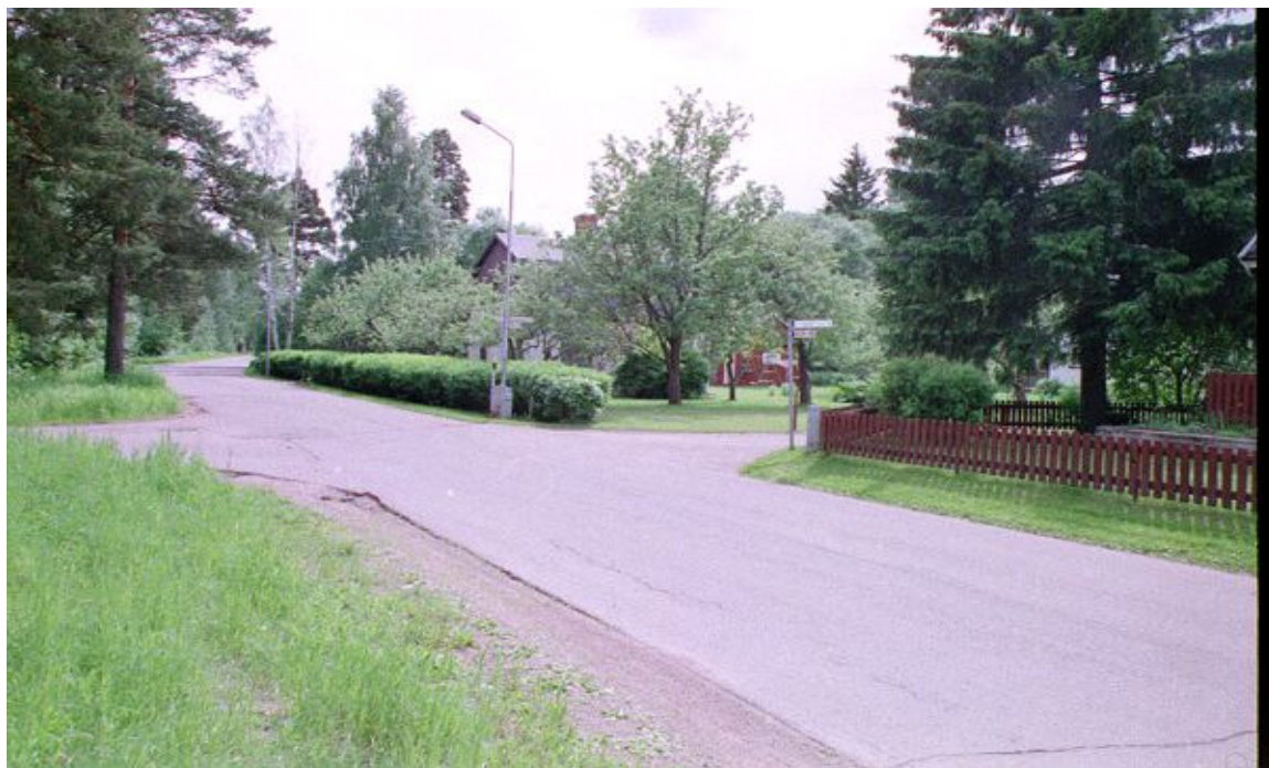
Ringargatan – Axelinas Gata 1999

Den västra sidan av området, som också är den senast bebyggda delen, har fått namn efter månader och årstider.