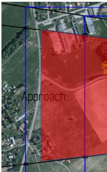
Figur 1. Nuvarande placering